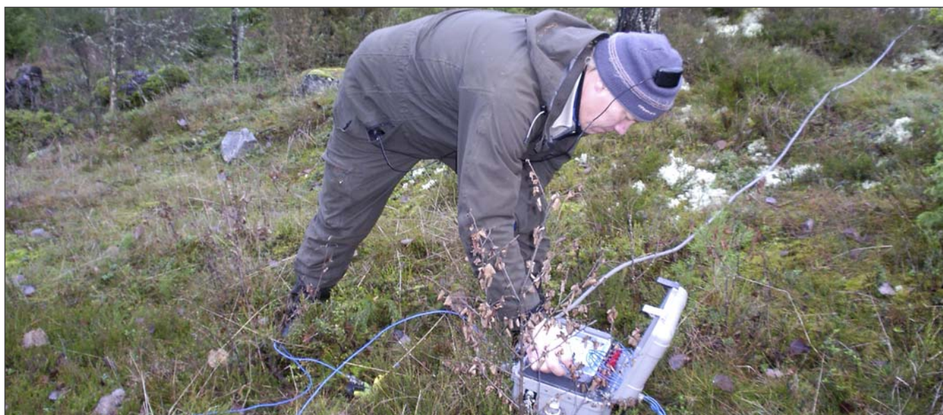
Geofysiska mätningar vid Solvik i Dalsland.

I tillägg till detta har Archelon tecknat avtal om att ingå som delägare med 15 procent av aktiekapitalet i bolaget Kilsta Metall AB, ett företag som med god lönsamhetspotential skall återvinna och uppjobba aluminium till stålindustrin.