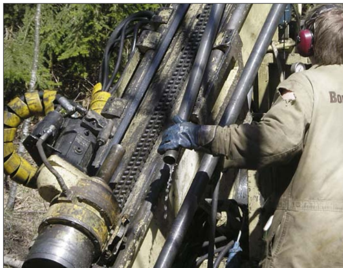
Vid kärnborrning i Solvik påträffades i första borrhålet en guldförande mineralisering med en högsta guldhalt på 9,5 g/ton på 70 meters djup. Borrprogrammet omfattar fyra hål.

Archelon har för avsikt att under 2007 uppgradera potentialen i undersökningstillstånden inom Vänern-Mjösa Goldbelt samt expandera närvaron i denna provins.