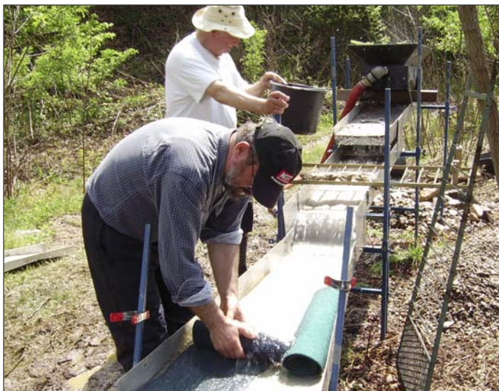
Provtagning av tennmineralet kassiterit i Serbien.

Under andra kvartalet 2007 påbörjades en detaljerad provtagning inom det ca 35 kvadratkilometer stora tillståndsområdet för att bekräfta tidigare rapporterade höga halter av tennmineralet kassiterit. Första fasen av undersökningsprogrammet beräknas pågå fram till juni 2007.