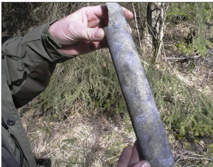
Rikt mineraliserad borrcärna från Solvik.

De som tecknade sig i Archelons nyemission i november 2006 kommer att under 2007 vederlagsfritt tilldelas aktier i Kilsta Metall motsvarande 7 procent av aktiekapitalet i bolaget. Efter att Kilsta Metall blivit anslutet till VPC kommer dessa aktier att distribueras, vilket beräknas ske under första halvåret 2007. Styrelsen i Kilsta Metall har för avsikt att under andra halvåret av 2007 besluta om publik notering av bolagets aktie.