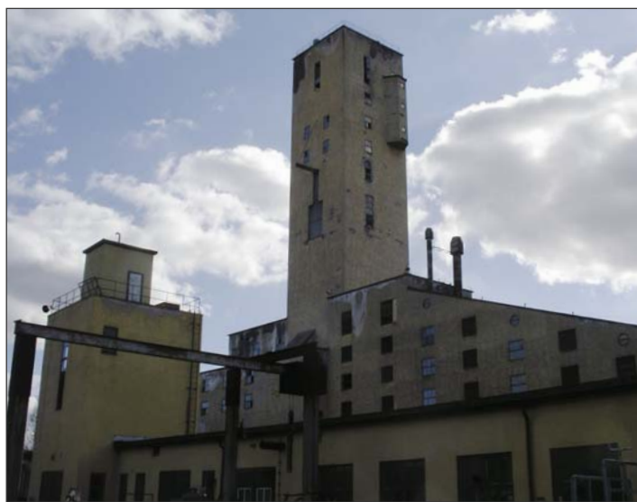
Gruvan i Blötberget var i drift fram till 1979.

Även andra gruv- och prospekteringsbolag har sökt undersökningstillstånd för järnmalm i Bergslagen. Archelon kommer under 2007 se på förutsättningar till olika former av samarbeten, där tanken är att man skall kunna betrakta existerande malmer som en samlad reserv. Detta skulle sannolikt öka möjligheten att få Bergslagen att återuppstå som en betydande aktiv och levande järnmalmssprovs.